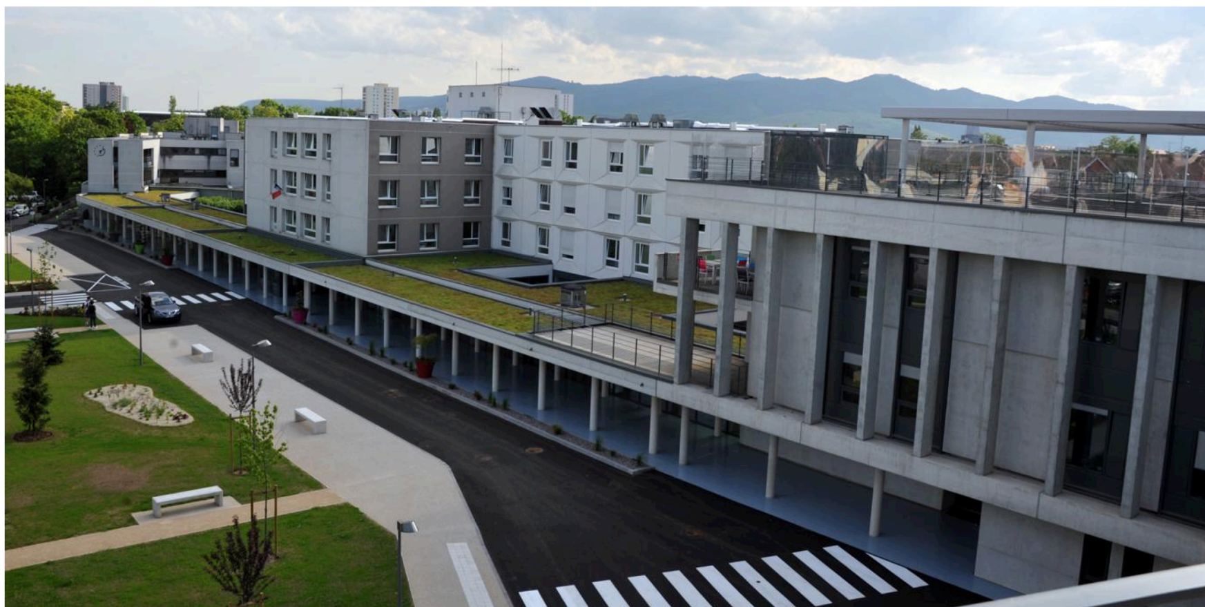
La configuration linéaire permet de recentrer le travail de chacun autour du pensionnaire.

zone logistique. 180 lits permettent d'accueillir les pensionnaires de l'Ehpad jusqu'ici dispersés dans trois pavillons différents : Dahlias, Cyclamens et Hortensias. Le projet a visé à les déconstruire en vue de la création d'une structure unique, actée par la signature en septembre 2010 d'un contrat pluriannuel d'objectifs et de moyens (CPOM) entre l'établissement et les représentants de l'État.