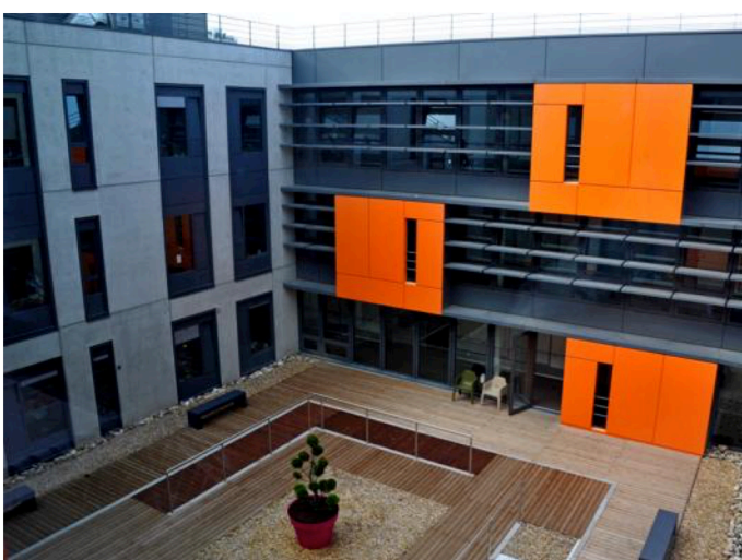
Le bâtiment est composé de 6500m 2 répartis sur trois niveaux.

« C'était un chantier énorme, le résultat est remarquable », s'est exclamé Gilbert Meyer, président du conseil de surveillance des hôpitaux civils de Colmar. Un investissement de 22 millions d'euros a été nécessaire à la réalisation des travaux, financés par le conseil