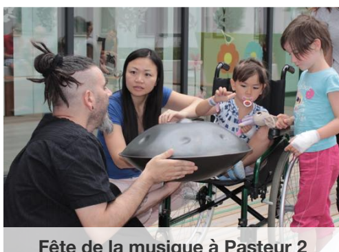
Fête de la musique à Pasteur 2