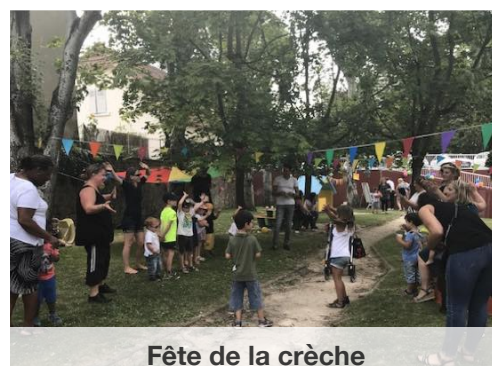
Fête de la crèche