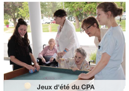
Jeux d'été du CPA