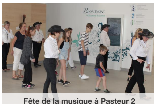
Fête de la musique à Pasteur 2