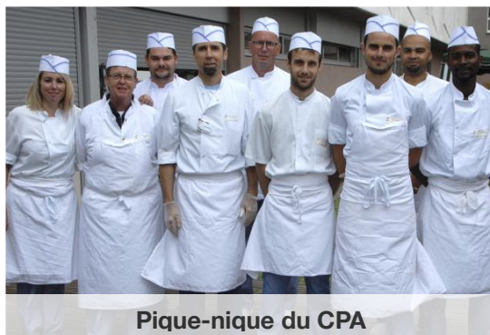
Pique-nique du CPA