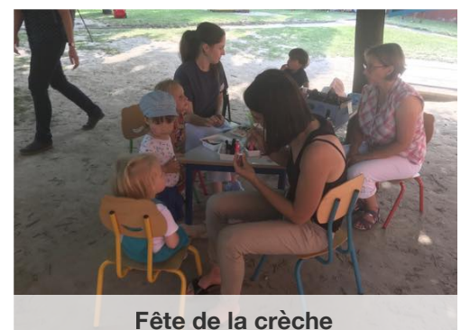
Fête de la crèche