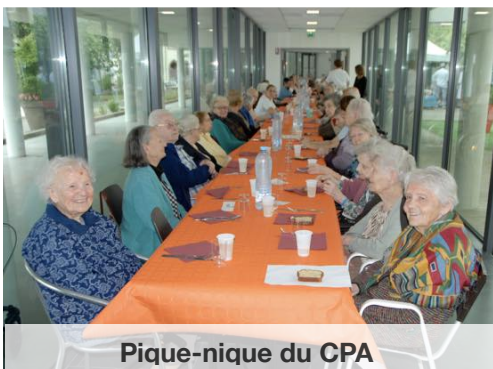
Pique-nique du CPA