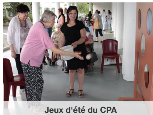
Jeux d'été du CPA