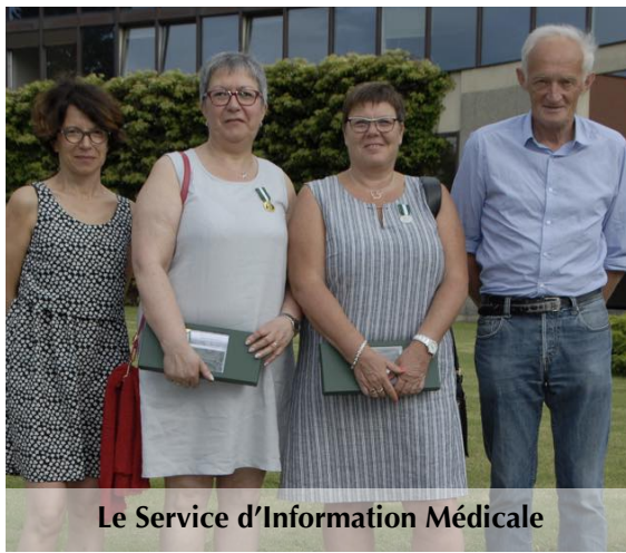
Le Service d'Information Médicale