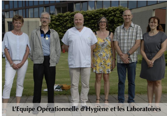
L'Equipe Opérationnelle d'Hygiène et les Laboratoires