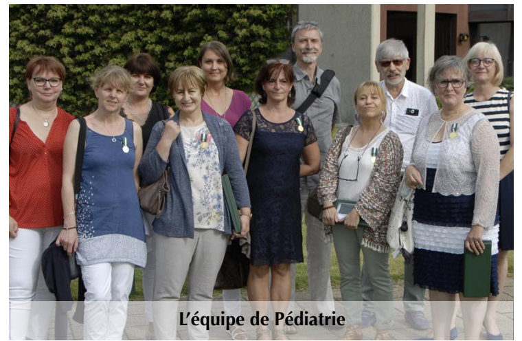
L'équipe de Pédiatrie