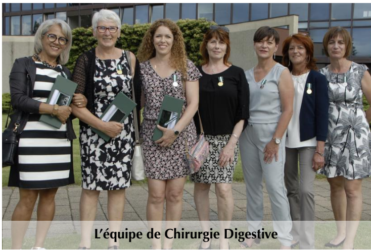
L'équipe de Chirurgie Digestive