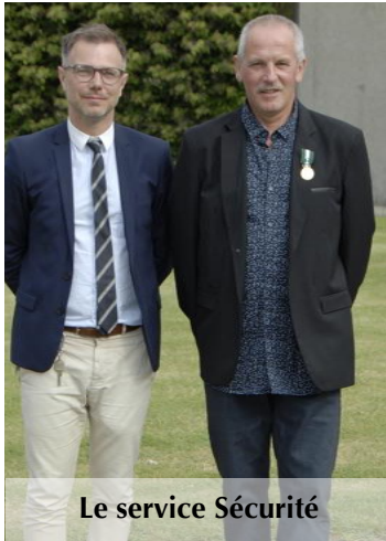
Le service Sécurité