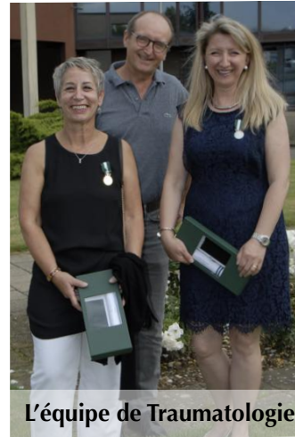
L'équipe de Traumatologie