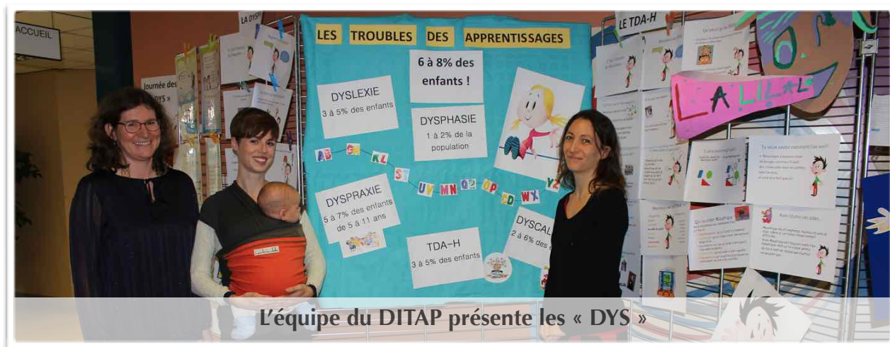
L'équipe du DITAP présente les « DYS »

C'est un handicap invisible mais réel , car ces enfants, intelligents, sont souvent en échec scolaire, et quand le trouble n'est pas diagnostiqué, il affecte la construction de l'enfant et finit par s'associer à d'autres troubles (dépression, troubles du comportement, etc...).