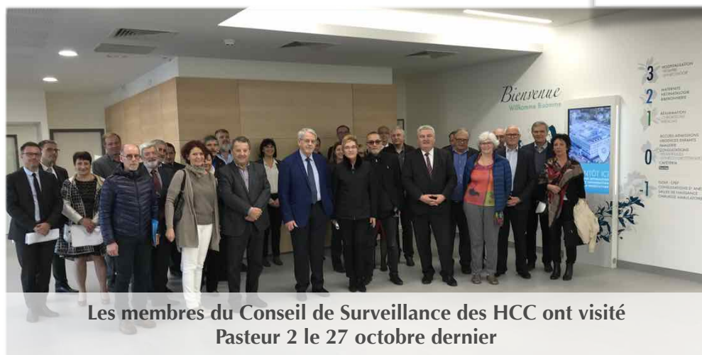
Les membres du Conseil de Surveillance des HCC ont visité Pasteur 2 le 27 octobre dernier