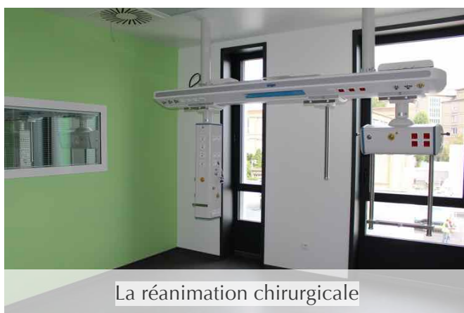
La réanimation chirurgicale