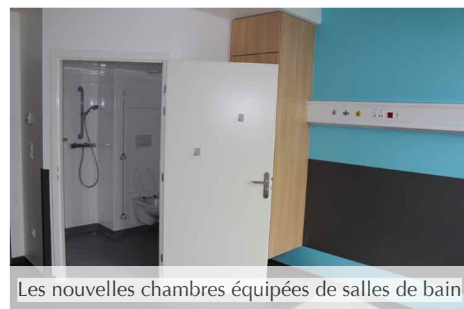
Les nouvelles chambres équipées de salles de bain