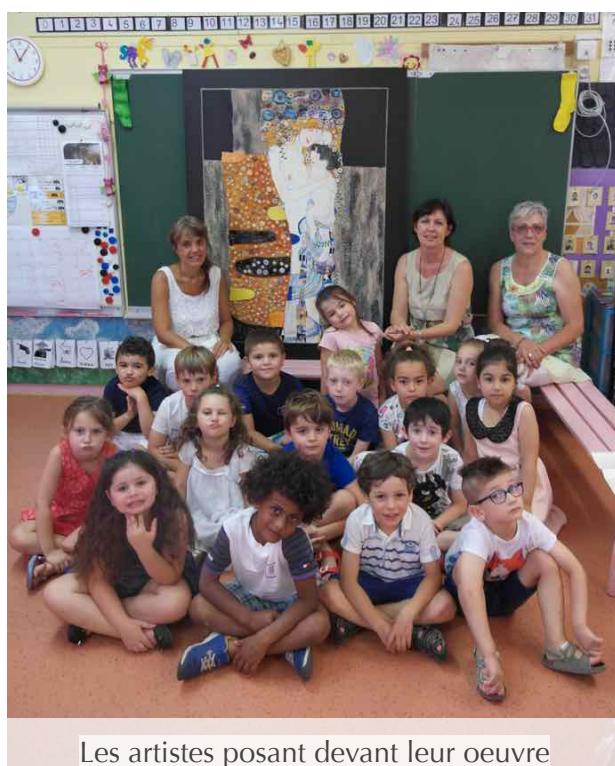
Les artistes posant devant leur oeuvre

Les élèves de moyenne et grande section de l'école maternelle Les Lilas de Turckheim sont de véritables artistes en herbe !