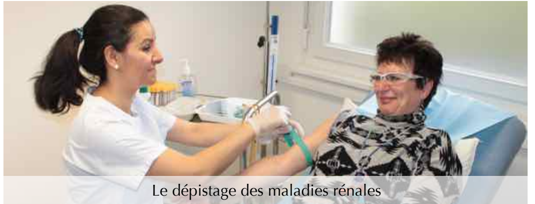
Le dépistage des maladies rénales

Ces journées ont remporté un franc succès : 246 personnes sont venues se faire dépister gratuitement et s'informer sur les maladies rénales , soit deux fois plus que l'an dernier !