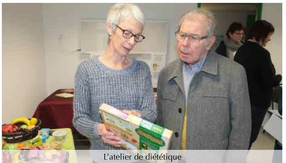
L'atelier de diététique

Une prise en charge anticipée des maladies rénales peut permettre à de nombreux patients d'éviter la dialyse. Les journées du rein ont permis de détecter une insuffisance rénale chez 53 personnes , soit 21% des participants. Un suivi néphrologique leur a été proposé.