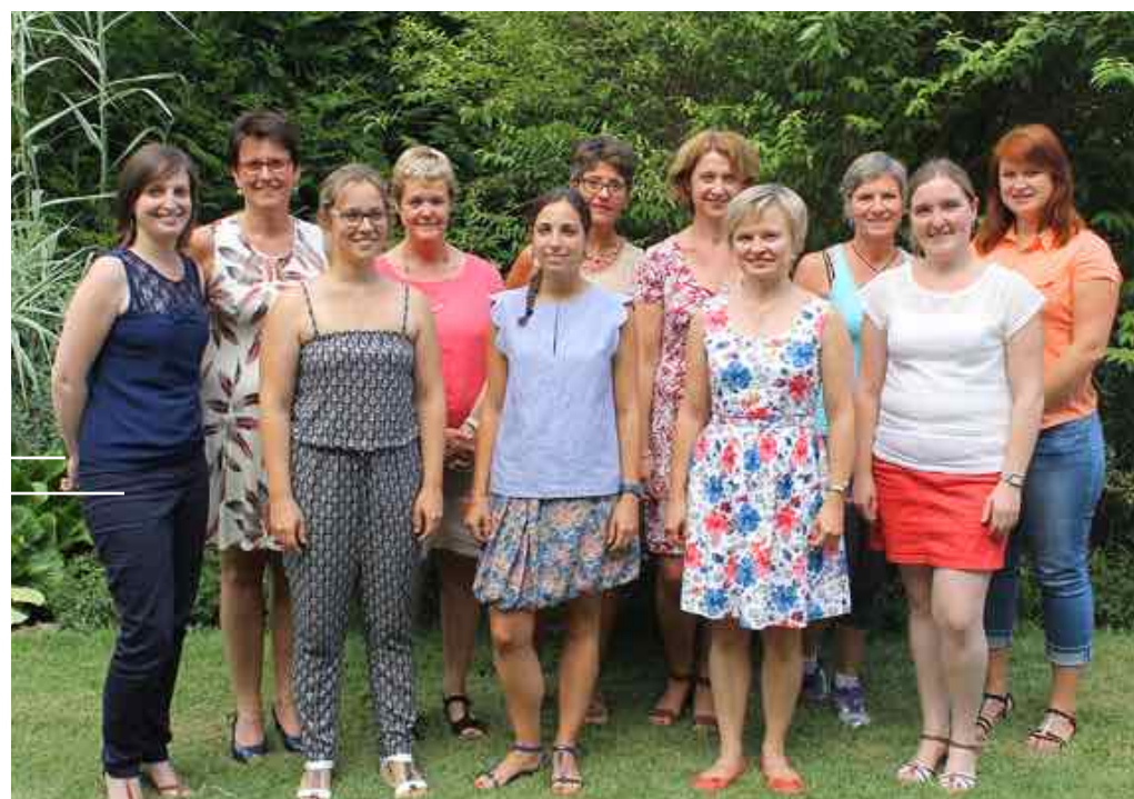
L'équipe du Centre Nutritionnel des HCC

Toute l'équipe du Centre Nutritionnel sera à la disposition des personnes intéressées par le sujet de l'obésité et du diabète.