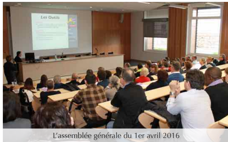
L'assemblée générale du 1er avril 2016