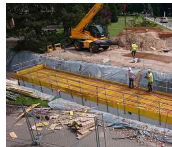
L'avancement des travaux des galeries, en quelques semaines