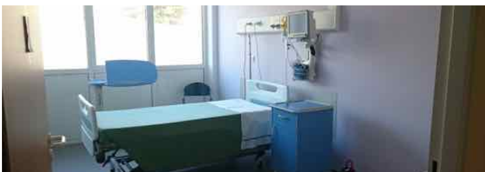
Au SAU: les nouvelles chambres...