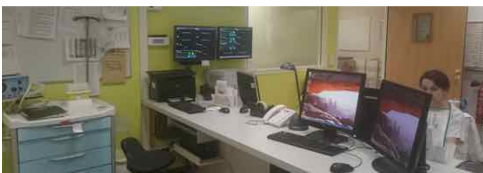
...et une nouvelle salle de soins.