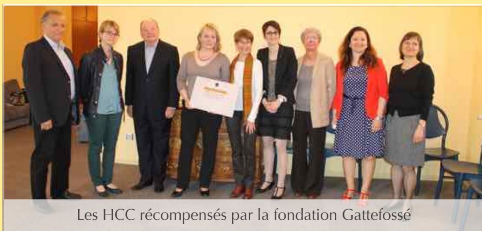
Les HCC récompensés par la fondation Gattefossé