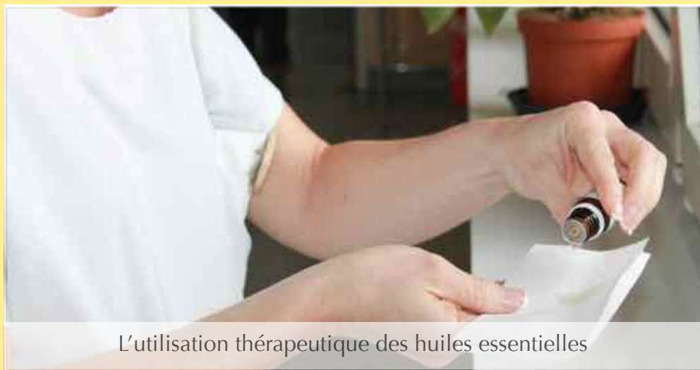
L'utilisation thérapeutique des huiles essentielles

Les résultats obtenus dans ce service ont permis de convaincre médecins et soignants d'autres services et d'étendre l'utilisation des huiles , selon un plan d'action défini, dans les autres unités du Service d'Oncologie (Soins Palliatifs, Oncologie-Hématologie), au Centre pour personnes âgées, et bientôt dans le service de réanimation médicale.