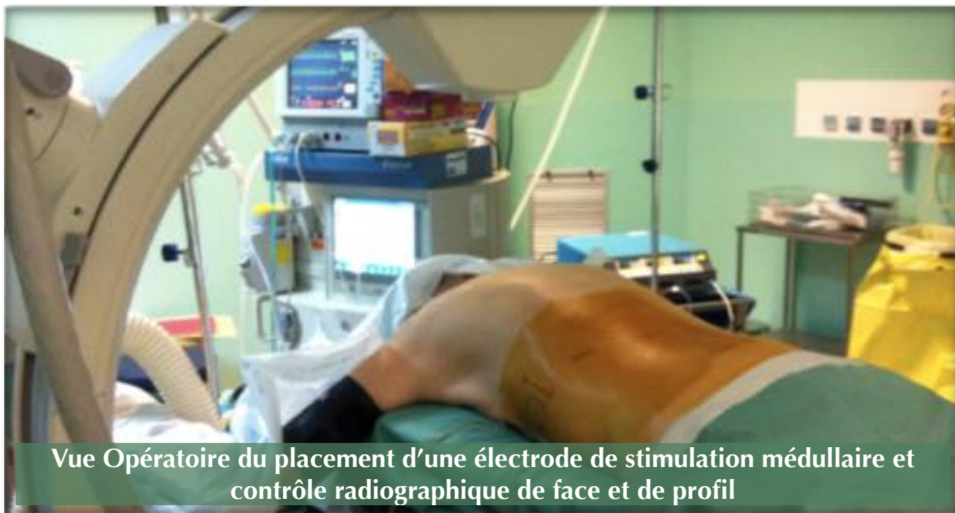
Vue Opératoire du placement d'une électrode de stimulation médullaire et contrôle radiographique de face et de profil

Le service de Neurochirurgie est impliqué depuis une dizaine d'années dans la prise en charge chirurgicale des lombalgies chroniques, en particulier par l'utilisation de l'arthroplastie lombaire.