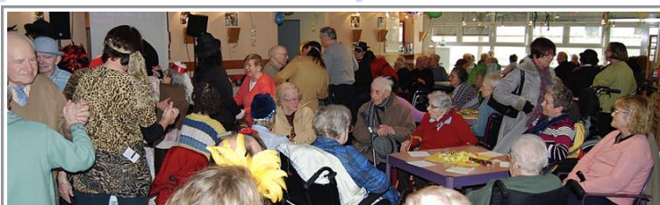
Festival du cinéma au CPA