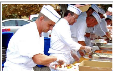
La rentrée du CPA