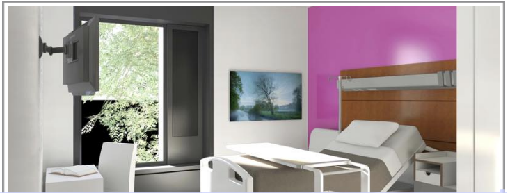
Nouvel EHPAD : notification des marchés de travaux