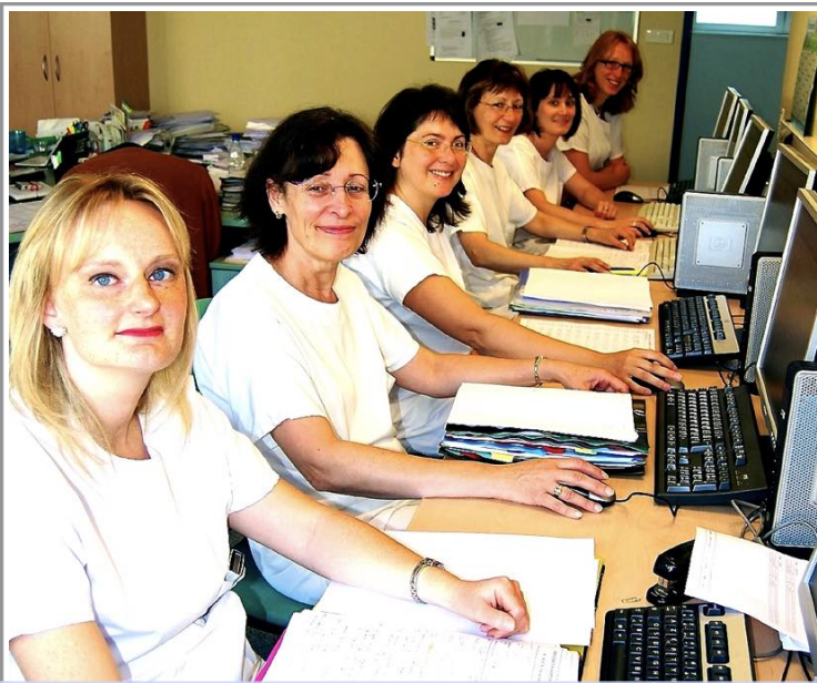
GICOR (gestion informatisée des commandes de repas)