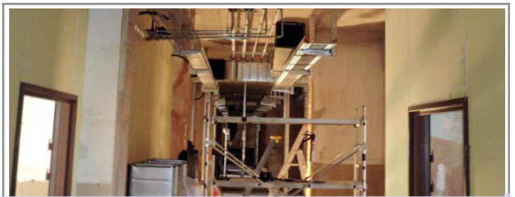
l'ancienne caserne RAPP : travaux de second œuvre