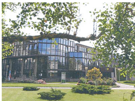
Ultramoderne. Des bâtiments clairs et spacieux.

Santé. Reportage au cœur des Hôpitaux civils de Colmar, un établissement de soins aux performances médicales surprenantes.